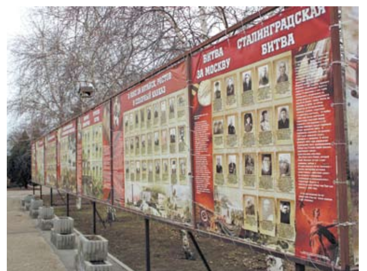
Музей под открытым небом школы №6.

В базе данных школы №6 хранятся сотни имен жителей района – ветеранов Великой Отечественной войны. У каждого есть учетная карточка (как правило, с фото), где указаны сведения: годы жизни, боевой путь, награды, за что награждены и так далее. Карточка существует как в бумажном, так и в электронном виде – последняя по функционалу и наполненности чем-то напоминает всем известную ОБД «Мемориал», но на местном материале и с подробностями.