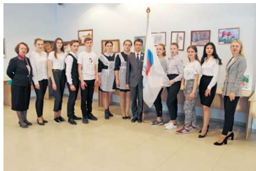
Российское движение школьников.

– В Батайске она и не прекращалась. Неслучайно музей школы №4 признан лучшим в Ростовской области