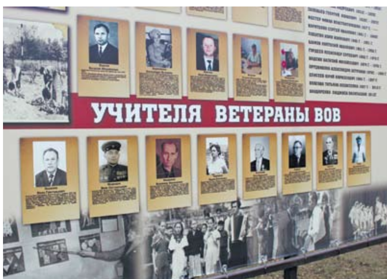
Музей под открытым небом школы №6.

– Сначала это была идея создания инициативной группы пап в школе №2. На собраниях обычно присутствуют только мамы, а как же отцы? Мы тоже можем помогать, участвовать в воспитании, можем и хотим! Хотелось бы поделиться с ребятами своими жиз-