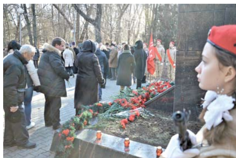
Юнармейцы несут вахту на дне памяти воинов-интернационалистов.