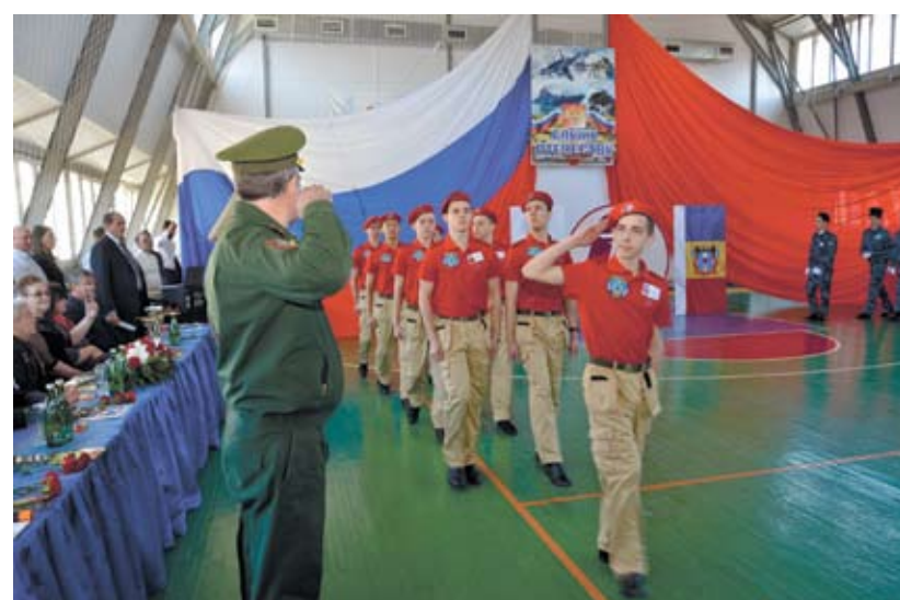
«Служу Отечеству» – ежегодные спортивно-военные состязания школ.