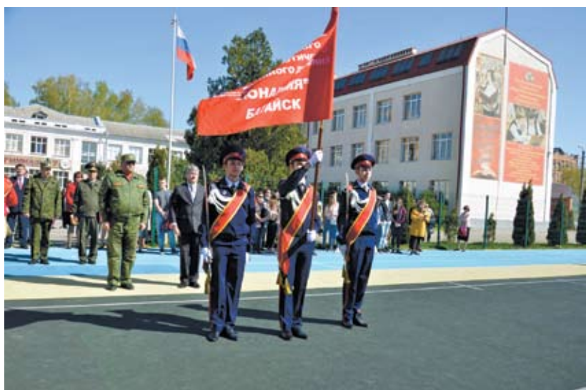
Торжественное мероприятие – вступление в ряды юнармии.

Беседовал Геннадий Громов